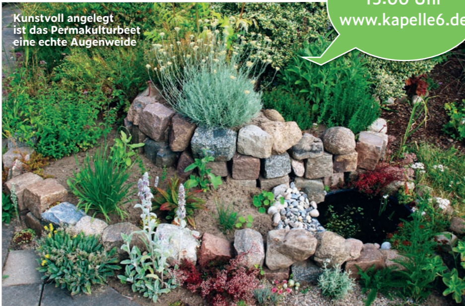
Kunstvoll angelegt ist das Permakulturbeet eine echte Augenweide