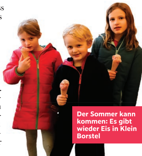
Der Sommer kann kommen: Es gibt wieder Eis in Klein Borstel