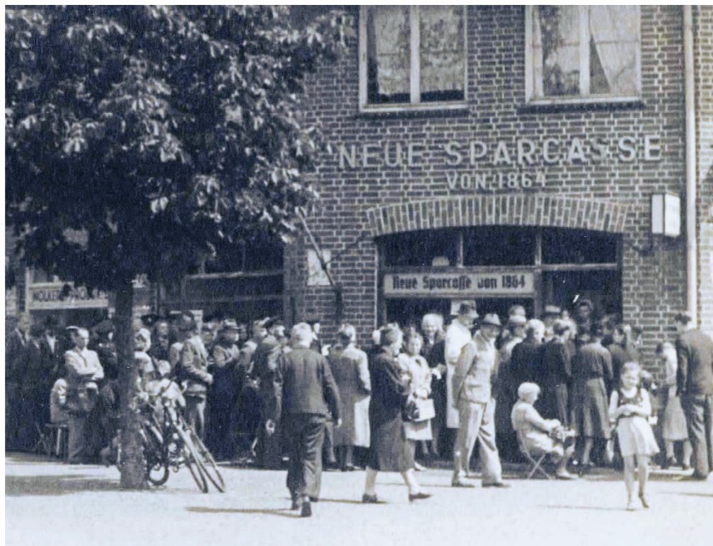
Vor der damaligen Niederlassung der Neuen Sparcasse warten die Klein Borsteler auf die Auszahlung von 40 Mark „Kopfgeld“

Ein warmer Sommertag vor 75 Jahren in Klein Borstel. Es ist Sonntag, der 20. Juni 1948. Ein Tag, der das Leben in den drei westlichen Besatzungszonen mit einem Schlag verändert hat. Die Männer und Frauen, die vor der Tür der „Neue Spar-casse“ (heute Restaurant „Vivere“) in unserem Dorf Schlange stehen, wissen das. Sie können ausnahmsweise einmal Sommerkleidung tragen in diesem nassen „Monsunsommer“ der Nachkriegszeit. Manche haben sich einen Stuhl mitgebracht, um die Wartezeit zu überbrücken. Kinder drängen sich in der Menge. Alle warten! Wann öffnet sich die Tür? Keiner will das verpassen. Denn heute ist endlich der Tag der heiß ersehnten Währungsreform. Jeder möchte das neue Geld in den Händen halten: Die 40 Deutsche Mark „Kopfgeld“!