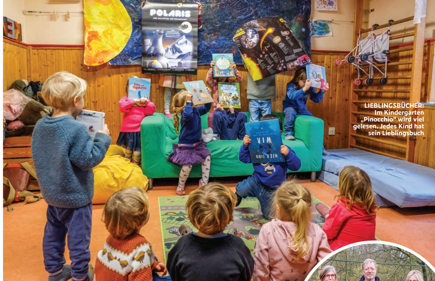
LIEBLINGSBÜCHER: Im Kindergarten „Pinocchio“ wird viel gelesen. Jedes Kind hat sein Lieblingsbuch