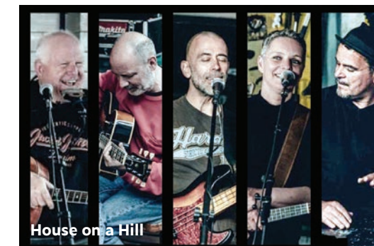
House on a Hill