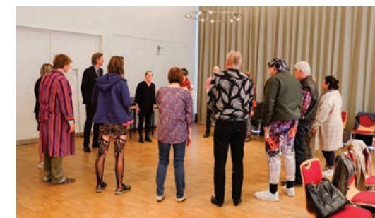
Warming up: Vor dem Gang auf die Bühne werden Lockerungsübungen gemacht