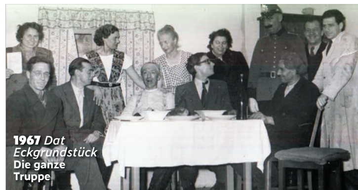
1967 Dat Eckgrundstück Die ganze Truppe