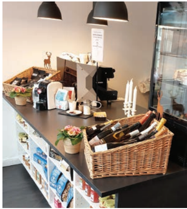
Edles Fleisch und tolle Zutaten: ein Sortiment für echte Feinschmecker