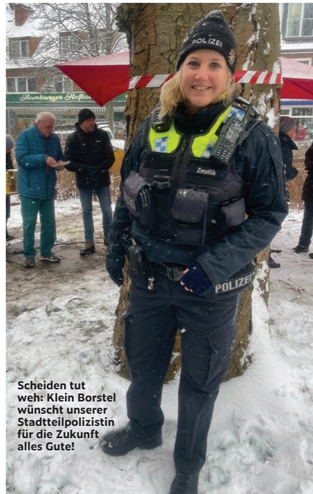
Scheiden tut weh: Klein Borstel wünscht unserer Stadtteilpolizistin für die Zukunft alles Gute!

große Fußstapfen. Die Bürgerinnen und Bürger von Klein Borstel werden den „Neuen“ aber bestimmt herzlich aufnehmen!