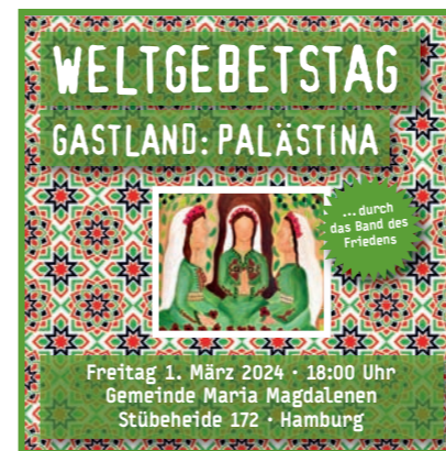
Plakat: ©Helmut Lindner

AM FREITAG, dem 01. März 2024, wollen wir zum ersten Mal regional den Weltgebetstag begehen. Der Weltgebetstag hat sich mit seiner über 100-jährigen Tradition zum Ziel gesetzt, auf die Situation von Frauen und Christ*innen weltweit hinzuweisen über alle kontinentalen und konfessionellen Grenzen hinweg. In diesem Jahr ist das Gastland Palästina. Angesichts des Krieges in Palästina wird der Gottesdienst den Charakter eines Friedensgebets haben. Die Musikbegleitung gestaltet die Regio-Band.