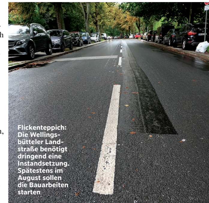
Flickenteppich: Die Wellingsbüttler Landstraße benötigt dringend eine Instandsetzung. Spätestens im August sollen die Bauarbeiten starten

Ja, unser Projektleiter hat eigens einen Puffer eingebaut, mit dem unvorhergesehene Verzögerungen, die bei einem solchen Projekt nicht auszuschließen sind, abgefedert werden können. Wir rechnen derzeit mit 2 Jahren Bauzeit für den ersten Abschnitt Wellingsbüttler Landstraße und 1,5 Jahre für den zweiten Abschnitt Wellingsbüttler Weg.